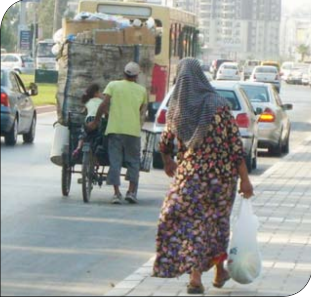
Şemikler - Yalı Mah. / Araba ile çöp toplayan çingene