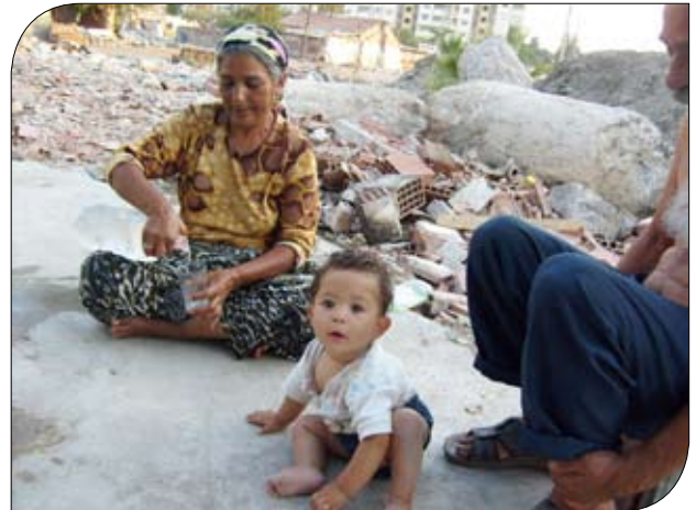
Semikler - Yalı Mah. / Babaanne - Dede ve Torun

Avrupa sahnesine çıktıkları ilk andan bu yana, gerek ten renkleri gerek giyim tarzları, gerekse yaşam biçimleri, kendilerine kuşku ile bakılmalarının temel nedenleri arasındadır. Toplumsal ve etnik dışlanmanın çeşitli biçimleri ile karşı karşıya gelen Çingenerler, Avrupa’da yaşadıkları tüm ülkelerde “toplumsal sorun” ve “tehlikeli sınıflar” olarak görülmüşlerdir ve görülmektedirler (Lucassen vd., 1998; Willems, 1998; Willems & Lucassen, 1998; Lucassen, 1998a; Fraser, 2005).