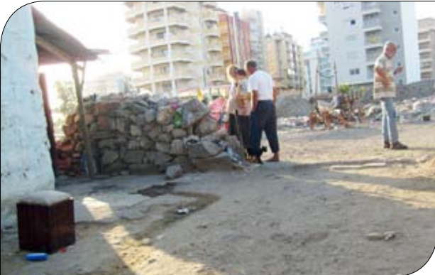
Şemikler - Yalı Mah. / Dede - Torun ve Gelin

Artvin, Erzurum, Sivas, Bayburt, Erzincan ve Ardahan'da "Poşa" (Boşa); Van, Hakkâri, Mardin, Siirt'te